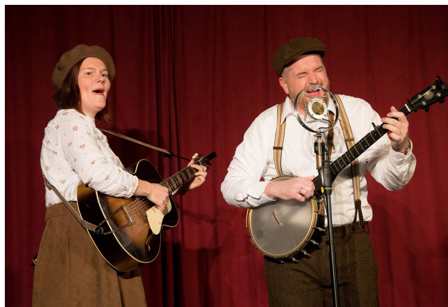
The Kentucky Tragedy

Einlass und Bewirtung 10.00 Uhr bis 11.00 Uhr, Konzertbeginn 11.15 Uhr.