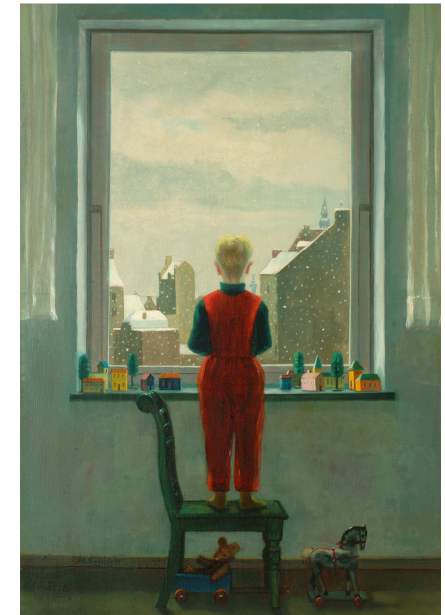
Heinz Baumgarte: Roland am Fenster (1960)

Tickets und Reservierungen während der Öffnungszeiten unter Telefon Café: 0511-10581302